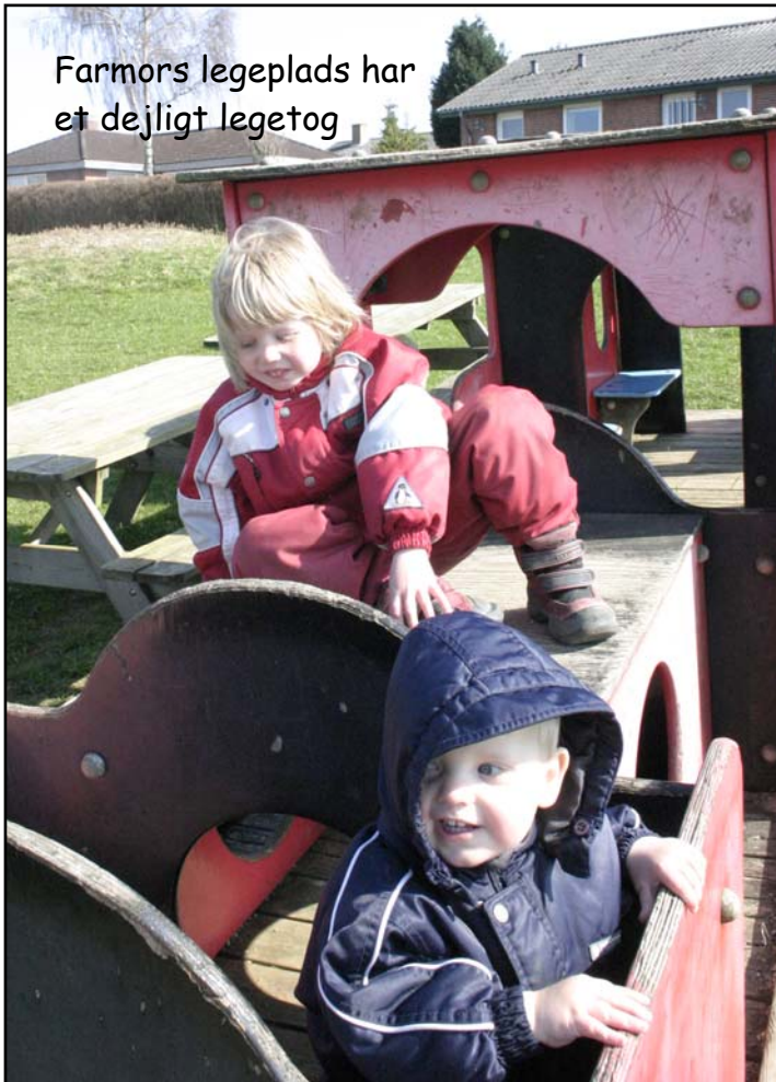
Farmors legeplads har et dejligt legetog