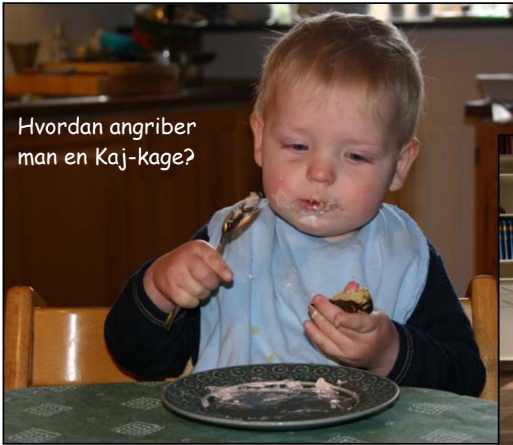
Hvordan angriber man en Kaj-kage?